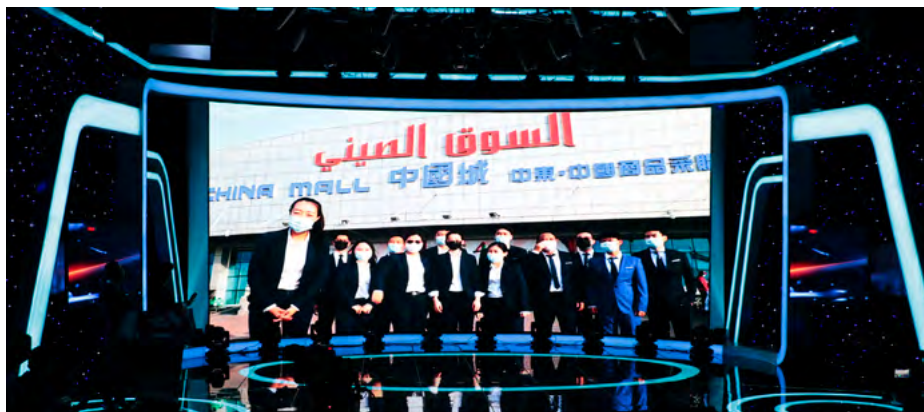
▲因海外驻派需要，阿治曼中国城团队无法到场领奖，特录制了视频祝贺活动取得圆满成功。

阿治曼中国城项目是博深集团深度融入“一带一路”建设的重要成果，作为首批国家级国际营销服务公共平台、国家级境外经贸合作区备选园区、湖南省首批境外经贸合作区，经过博深6年的管理运营经验积累，打造了一支敢闯、敢拼、敢干的年轻而优秀的管理团队。他们在工作岗位恪尽职守，在异国他乡有为担当，有力地推动了阿治曼中国城项目的稳定和发展，助力了中国和阿联酋双边经贸交流，宣传推广了中国文化，成为国家“一带一路”建设的