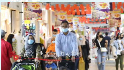
夜空中生活街,灯火璀璨