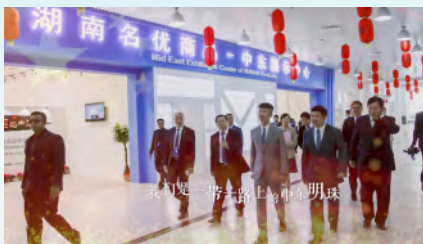
中国是一带一路上的明珠